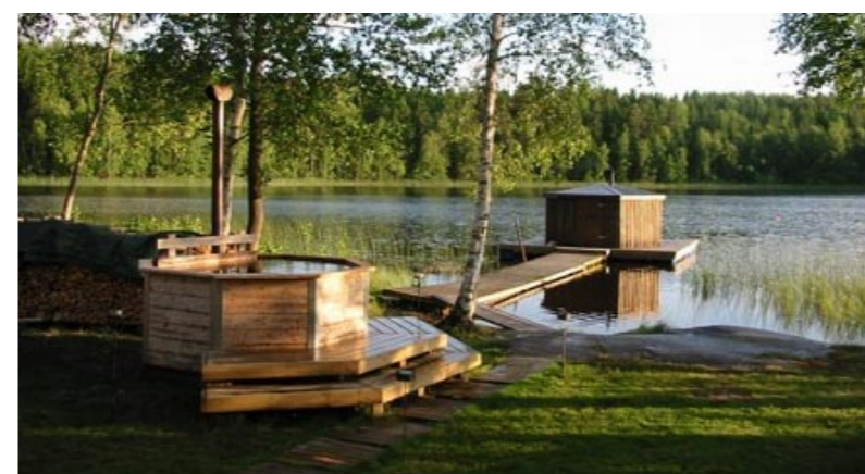
Äventyrsgården tar emot förbokade grupper om minst sex personer.

Mer information om Ulrika finns på www.ulrikainfo.se