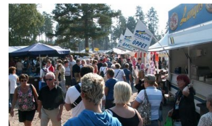
Ulrika marknad andra torsdagen i september. Det är här man gör FYNDEN.