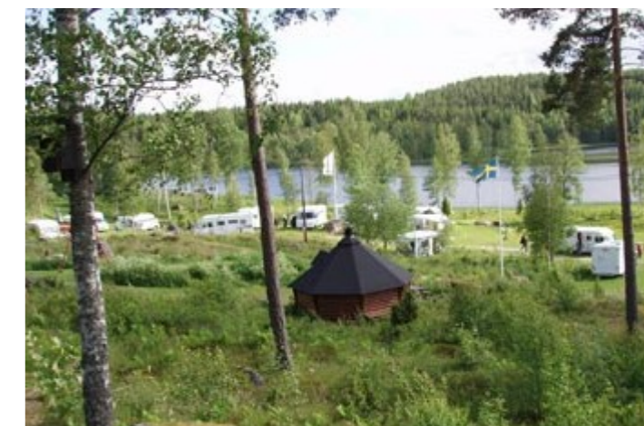
Bo på camping, i stuga eller på bondgård. Fritidslandet har alternativen.