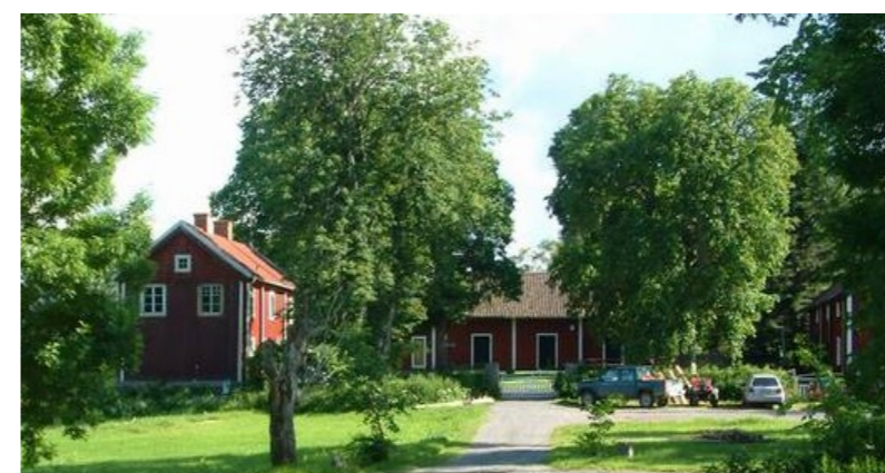
Jakt- och äventyrsgården Bäck med allt från stillhet till jägarexamen.