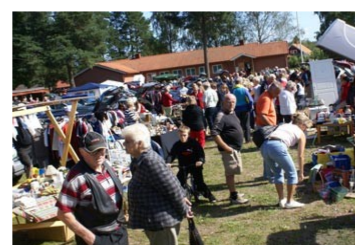
Bakluckeloppis anordnas tredje söndagen i maj till och med augusti på marknadsplanen vid museet