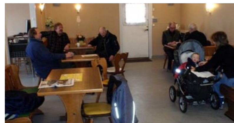
Ulrika Butik & Café Ekonomisk förening har det du behöver, när du behöver det.