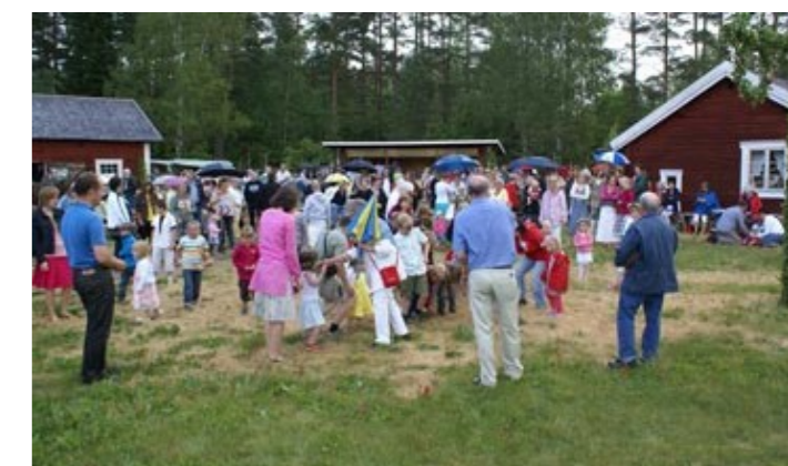
Ulrika hembygdsområde, Källeryd. Platsen för midsommar.