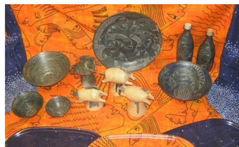
AKEWA Keramik tillverkar drejade bruksföremål av stengods med glasyr av aska från ulrikaskogarna.